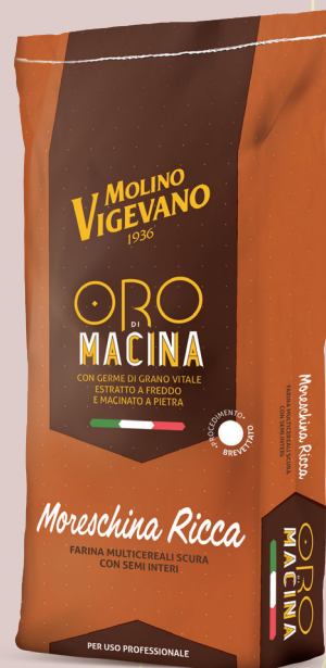
Sacco da 10 kg